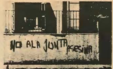
Συνθήματα στους δρόμους του Σαντιάγο: «Κάτω ή Χούντα των δολοφόνων».

Όπως είδαμε το MIR αποτελεί σήμερα μαζί με τις άλλες οργανωμένες δυνάμεις της αριστεράς στην Χιλή ένα επαναστατικό κίνημα που αγωνίζεται ένοπλα στην στρα-